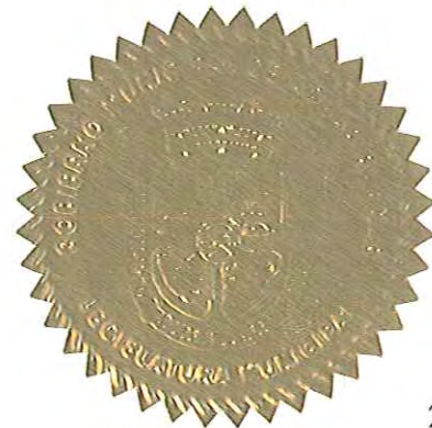
LUIS ARROYO CHIQUÉS ALCALDE

APROBADA Y FIRMADA POR EL HON. LUIS ARROYO CHIQUÉS, ALCALDE DE AGUAS BUENAS, PUERTO RICO, EL DÍA 15 DE agosto DE 2013.